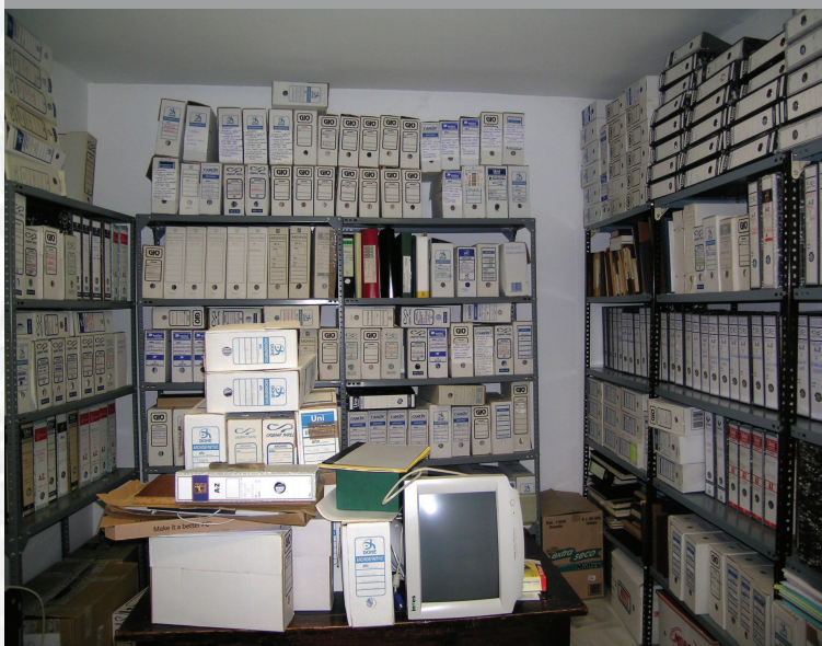
Archivo Municipal de Atalaya antes de la elaboración del Inventario.