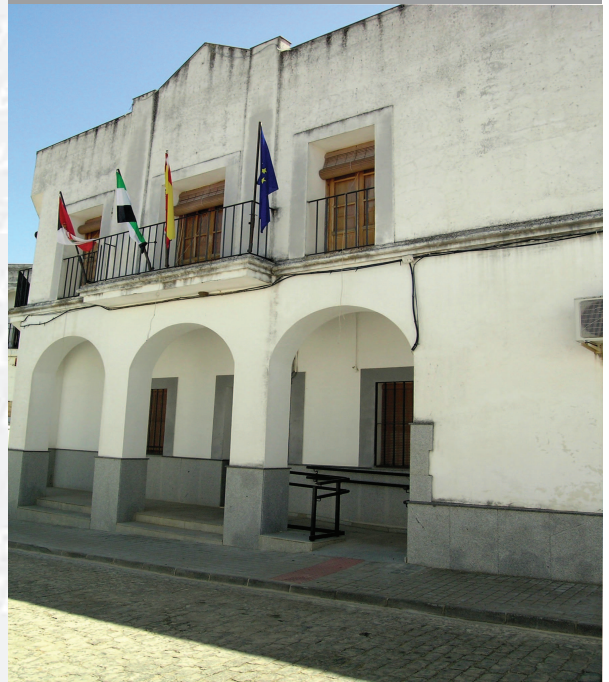
Archivo Municipal de Atalaya

... Betonia, p ... Españole ... Tiene su ... por el ... el Reyno ... por el ... Castilla ... y parte de ... Fuera, por el Medio ... ucia, y por el Occidente con el ... incia del Reyno de Portugal ... rnte a sus, 52. leguas, y ... Norte por lo mas ancho ... fertilidad en esta Pro- ... Rios Tago, y Guadiana, ... rtesan por en medio, y ... rchicas, que son el demon- ... y el Ardilla & Badajoz ... la, Capital de la Provin- ... Obispado, y en Puente sobre ... rima, edificada por los ... llada de Guerra y tiene ... Castillos, el uno del ... rnal, y del otro lado ... rro esta el fuerte de S. ... Merida y en esta Angu- ... nro tiempo viveza de la antigua ... tural de saber el Rio Guadiana.