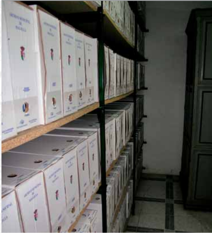
Archivo Municipal de Maguilla después de elaborar el Inventario.