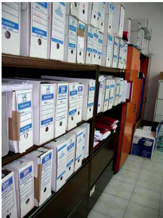
Archivo Municipal de Maguilla antes de la elaboración del inventario.