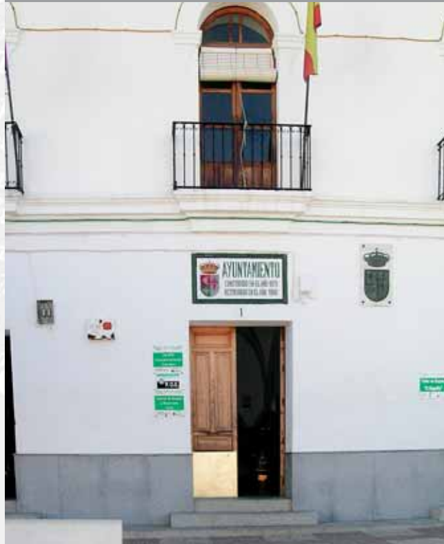
Fachada del Ayuntamiento.